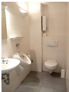
WC Herren - Damen