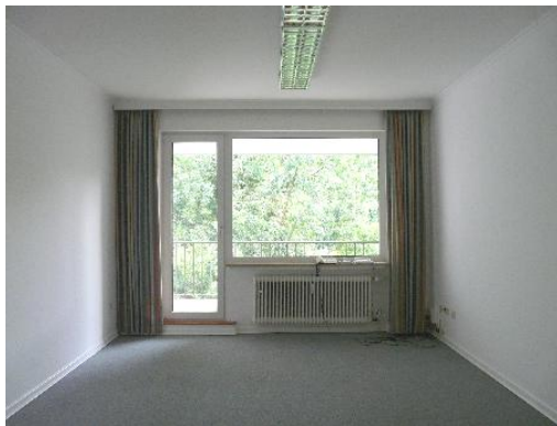
Büro 1 - 2