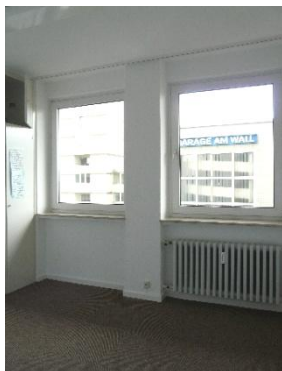
Büro 5 - 4